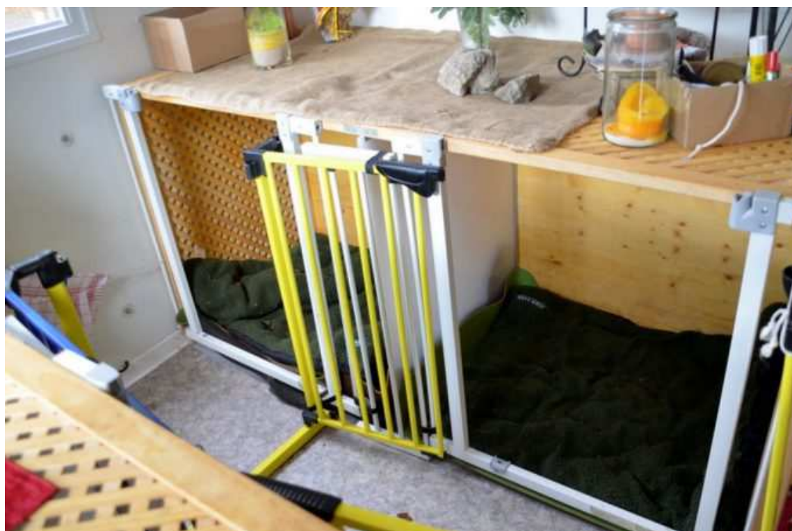
Im Inneren des Schäferwagens bieten kuschelige Kojen die Möglichkeit zum Aufwärmen und Ausruhen. Die Kojen sind offen, so dass jedes Tier selbst wählen kann.

Neben der Hundebetreuung bietet die 39-jährige eine hochwertige Produktpalette von Tiernahrung und Zubehör an, vor allem Bio- und Naturprodukte. Jeder Kunde wird ausführlich informiert und beraten. Zu wärmeren Jahreszeiten sorgt der Cold & Dog Frozen Joghurt für eine bekömmliche Erfrischung. Das Produkt wird in der Berliner Hundeeismanufaktur Cold & Dog (EU-zugelassen) hergestellt. Auf dem Gebiet der Hundeernährung will sich die Tierbetreuerin spezialisieren.