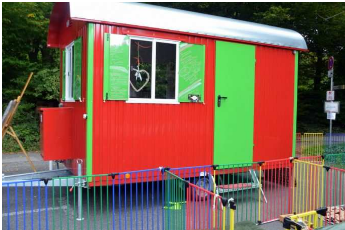
Der leuchtend bunte Schäferwagen steht am Parkplatz Glüder. Wer möchte, kann gerne vorbeikommen und sich informieren. Noch gibt es freie Plätze.

Ein interessantes, breitgefächertes Konzept hat sie entwickelt. Der komplette Tag ist im Sinne der Hunde gestaltet. Neben dem artgerechten Betreuen steht die gewissenhafte Versorgung der Tiere. „Dabei halte ich mich natürlich an die Wünsche meiner Kunden.“ Auf den Wanderungen darf eine Hunde-Leckerli-Tüte nicht fehlen. Spielerisch und mit großem Spaß üben die kleinen Begleiter bei Fuß gehen oder Männchen machen. Natürlich mit einer Belohnung im Anschluss.